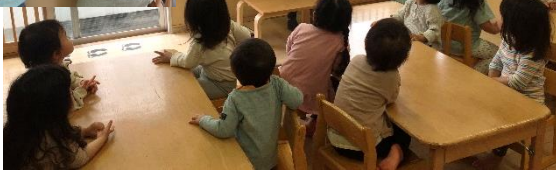
めいえをしながら手洗いの順番待ち！