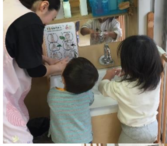
真剣に看護師のお話を聞くくま組さん 🐻

絵本「きんのオリゼー てをあらおう」を真剣に聞き、その後みんなで手洗い歌を歌いながら実際に手を洗いました。看護師の手の動きを真似しながら、一生懸命手洗いをするくま組さんでした♪ 手洗い後「ばいきんないー！」「きれいになったー！」と両手を見せに来てくれるお友達もいました！